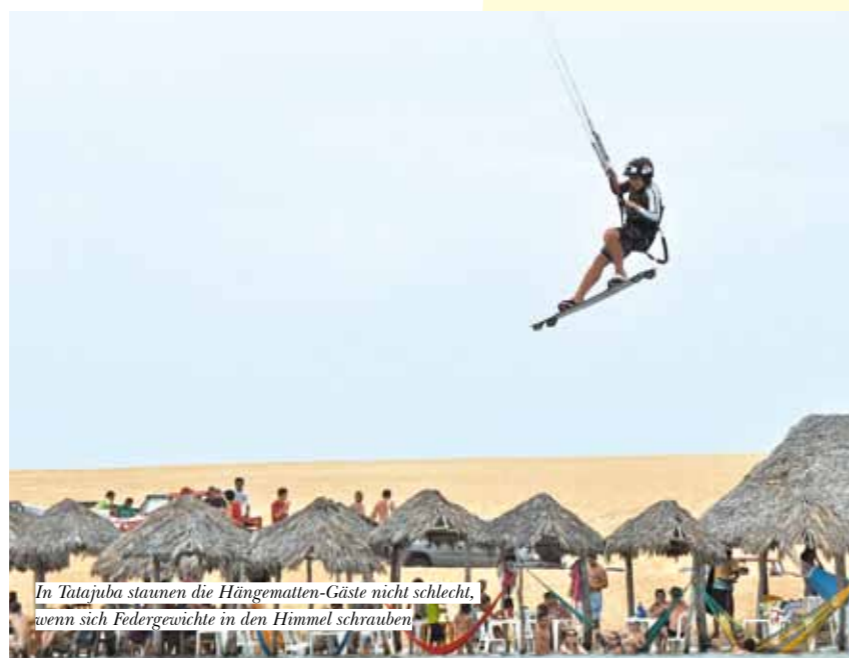
In Tatajuba staunen die Hängematten-Gäste nicht schlecht, wenn sich Federgewichte in den Himmel schrauben