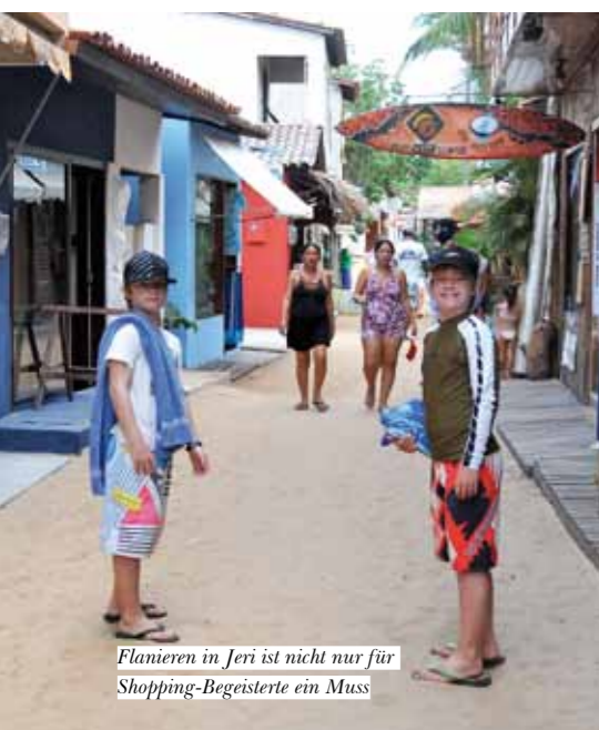
Flanieren in Jeri ist nicht nur für Shopping-Begeisterte ein Muss

Tatajuba Lagune – Flachwasser im Paradies! Allein die Fahrt zu dieser riesigen Süßwasserlagune ist schon ein Erlebnis. Knapp eine Stunde lang fährt man über Sanddünen und durch Mangrovenwälder. Dabei überquert man mit dem Buggy in einer abenteuerlichen Floßfahrt einen Fluss. Die „Lagoa Tatajuba“ liegt paradiesisch inmitten von lang gezogenen Dünen und hohen Palmen. Hier haben wir den besten Fisch des ganzen Urlaubs gegessen. Dabei saßen wir an