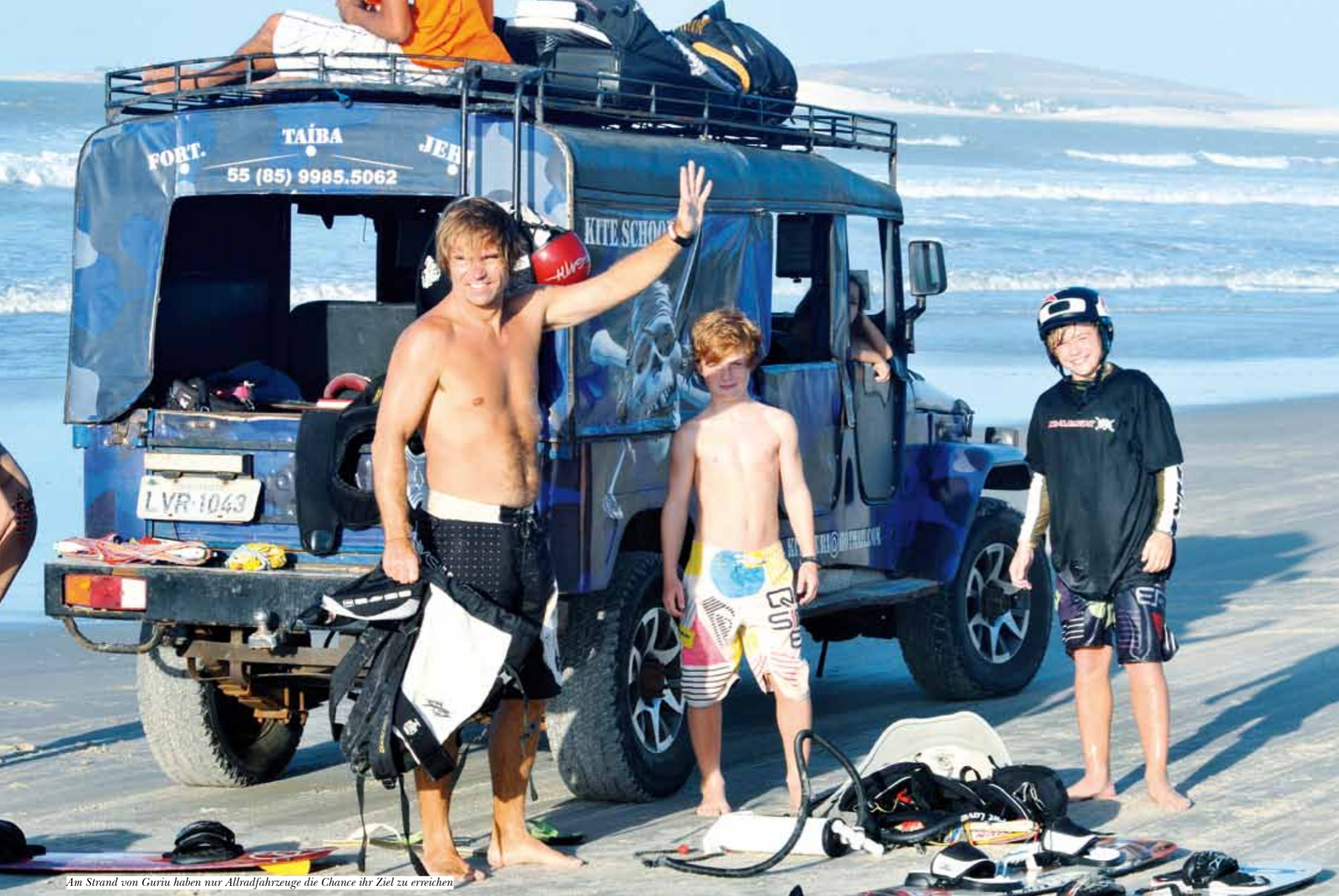
Am Strand von Guriu haben nur Allradfahrzeuge die Chance ihr Ziel zu erreichen